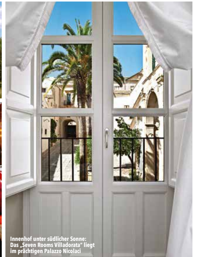
Innenhof unter südlicher Sonne: Das „Seven Rooms Villadorata“ liegt im prächtigen Palazzo Nicolaci