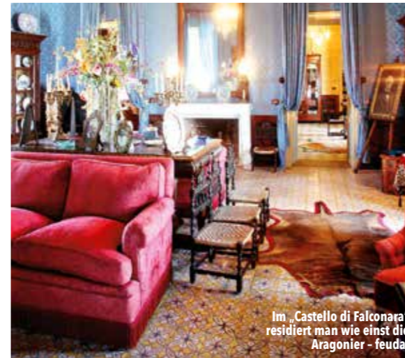
Im „Castello di Falconara“ residiert man wie einst die Aragonier – feudal