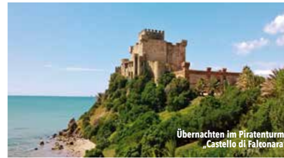
Übernachten im Piratenturm: „Castello di Falconara“