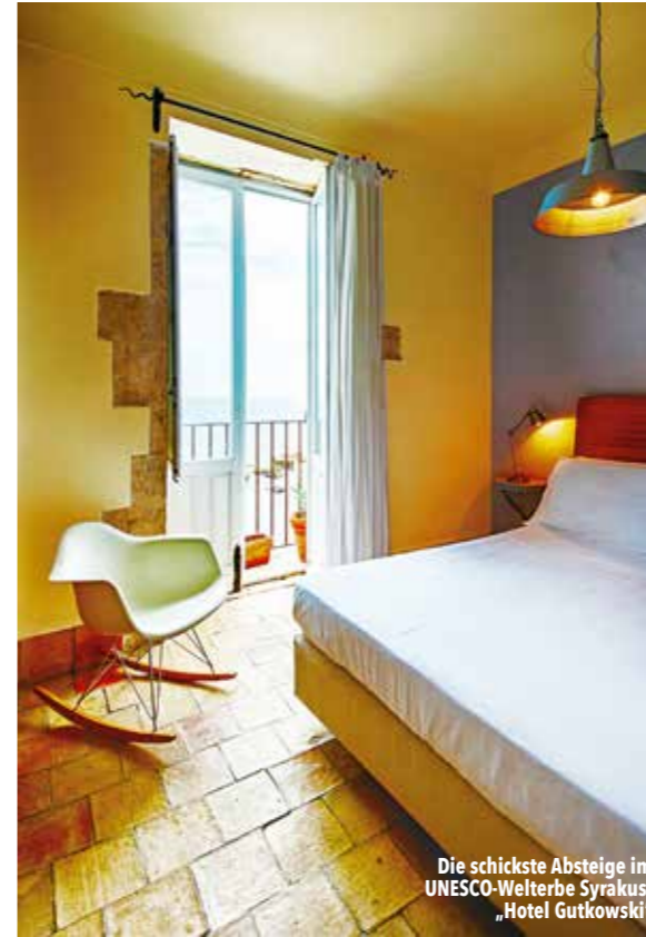
Die schickste Absteige im UNESCO-Welterbe Syrakus: „Hotel Gutkowski“