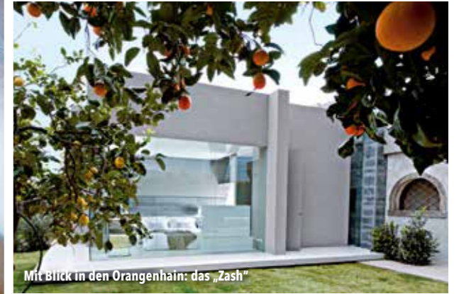
Mit Blick in den Orangerhain: das „Zash“