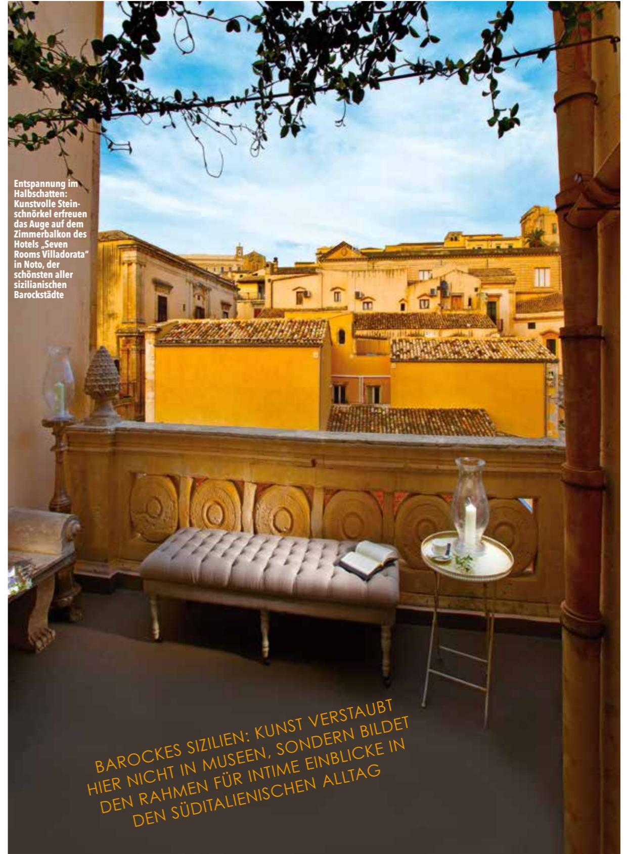
Entspannung im Halbschatten: Kunstvolle Steinschnörkel erfreuen das Auge auf dem Zimmerbalkon des Hotels „Seven Rooms Villadorata“ in Noto, der schönsten aller sizilianischen Barockstädte

BAROCKES SIZILIEN: KUNST VERSTAUBT HIER NICHT IN MUSEEN, SONDERN BILDET DEN RAHMEN FÜR INTIME EINBLICKE IN DEN SÜDITALIENISCHEN ALLTAG