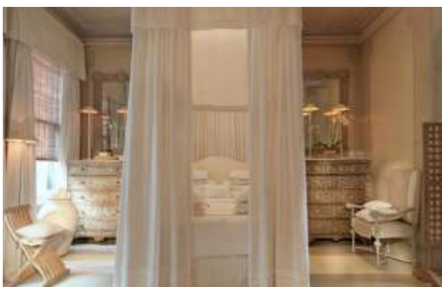
BLAKES HOTEL A LONDRA