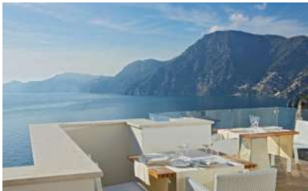
CASA ANGELINA AD AMALFI