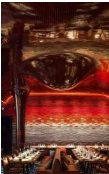
LES BAINS A PARIGI